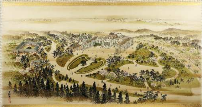
【神苑図誌】より「倉田山」（縦38.1cm × 横78.8cm）

この資料は会が解散する2年前であることから関係者へそれらの事績を紹介し伝える目的で製作したものであると思われます。同図は神宮徴古館にも収蔵されており、その図との関係性や左洲の精巧な筆致は資料としての価値も興味深いものです。